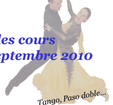
Tango, Paso doble...

Début des cours Le lundi 13 septembre 2010